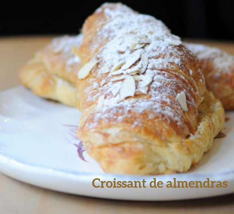
Croissant de almendras